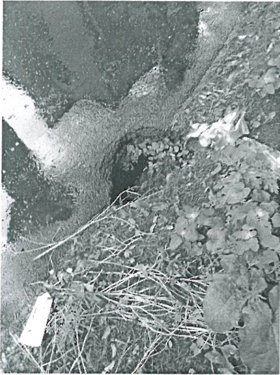
Lisa 1 (kolmes lehes)