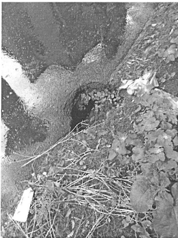
Lisa 1 (viies lehes)