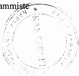
Tarmo Tammiste Linnapea

Handwritten signature of Tarmo Tammiste.