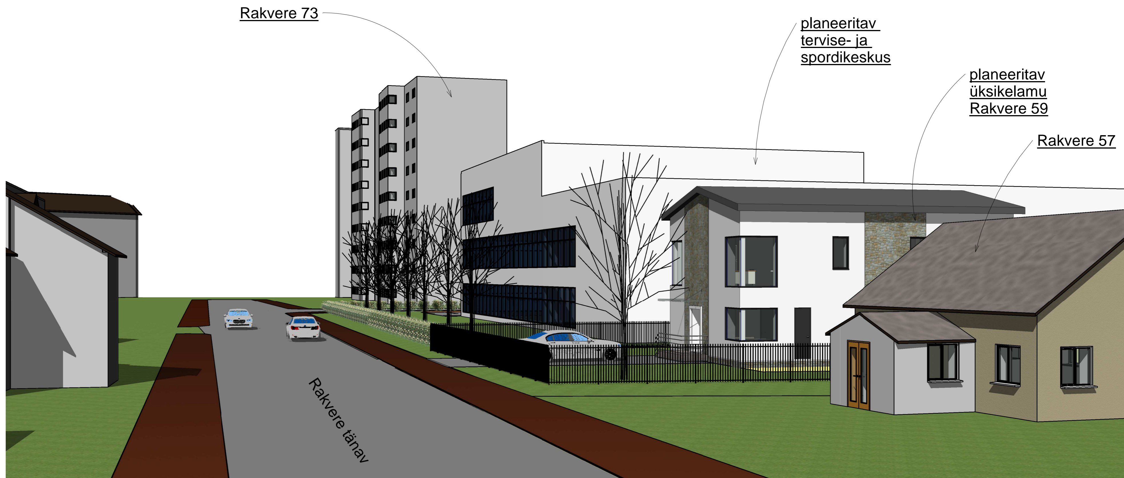
Vaade Rakvere-Puskini tn. ristmiku poolt M: