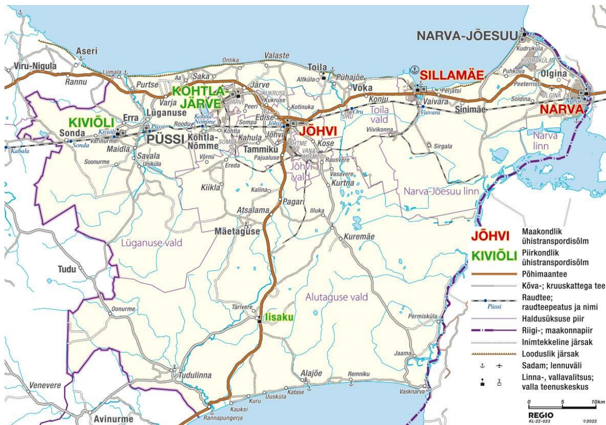
Joonis 3. Ida-Viru maakonna tööstus- ja ettevõtluspiirkonnad ning puhke- ja rekreatsioonipiirkonnad, Ida-Virumaa ühistranspordisõlmed. Regio kaart

Tööstus ja ettevõtluspiirkonnad koonduvad suuremate linnade ja linnastute juurde.